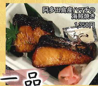
阿多田島産ハマチの 海賊焼き 1,350円