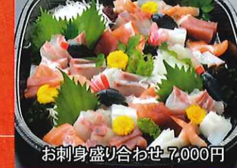
お刺身盛り合わせ 7,000円