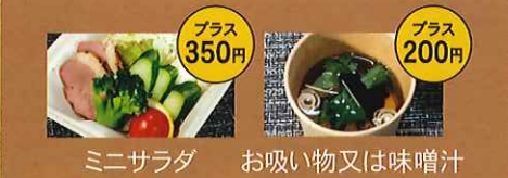
ミニサラダ お吸い物又は味噌汁