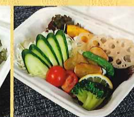
シーザーサラダ 650円