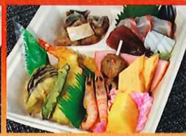
ひょうたん弁当 1,750円