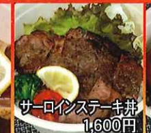
サーロインステーキ丼 1,600円