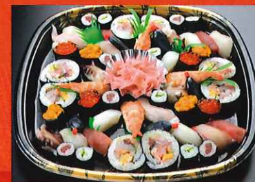
ファミリー 寿司セット松 10,500円