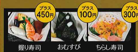
握り寿司 おむすび ちらし寿司