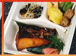
阿多田島産ハマチ(片身)の 海賊焼き弁当 980円