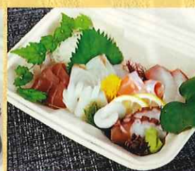
お刺身の盛り合わせ 1,350円