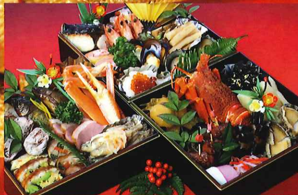
プレミアムおせち三段重ね 34,000円

※おせちは予約制です。お早めにご用命ください。 ※商品はすべて税込み価格です。 ※大竹市ヨイちゃんクーポン券がご利用できます。