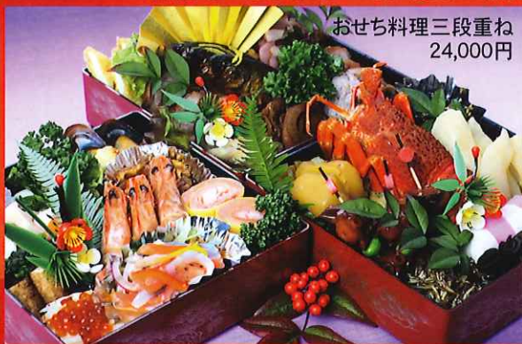
おせち料理三段重ね 24,000円 おせち料理二段重ね 13,500円