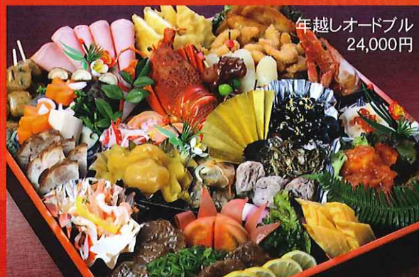
年越しオードブル 11,500円~24,000円