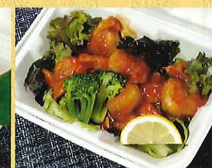
特製中華海老のチリソース 820円