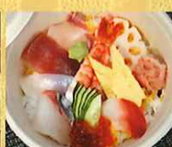
海鮮ちらし寿司 1,200円