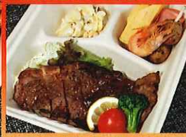
サーロインステーキ弁当 1,800円